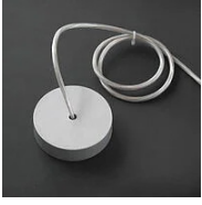
30721 Rosone Shanghai